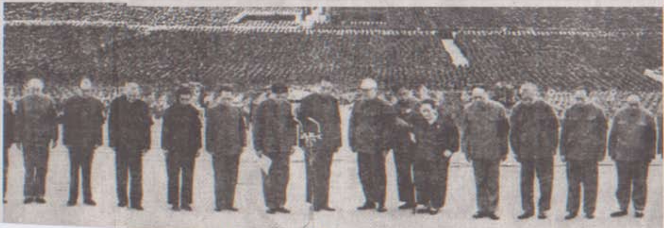
...van de originele foto (boven) van een herdenkingsceremonie voor Mao Zedong op het Plein van ... herdenkingsceremonie van Mao. Na diens dood in 1976